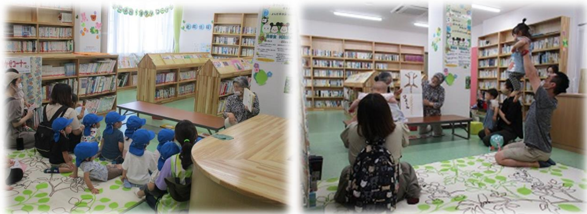
担当：おはなしの会 グーチャーパー 東四郎丸児童館

「ぴょーん」では、お母さんお父さんと“たかいたか〜い”をして、カエルさんに変身です。